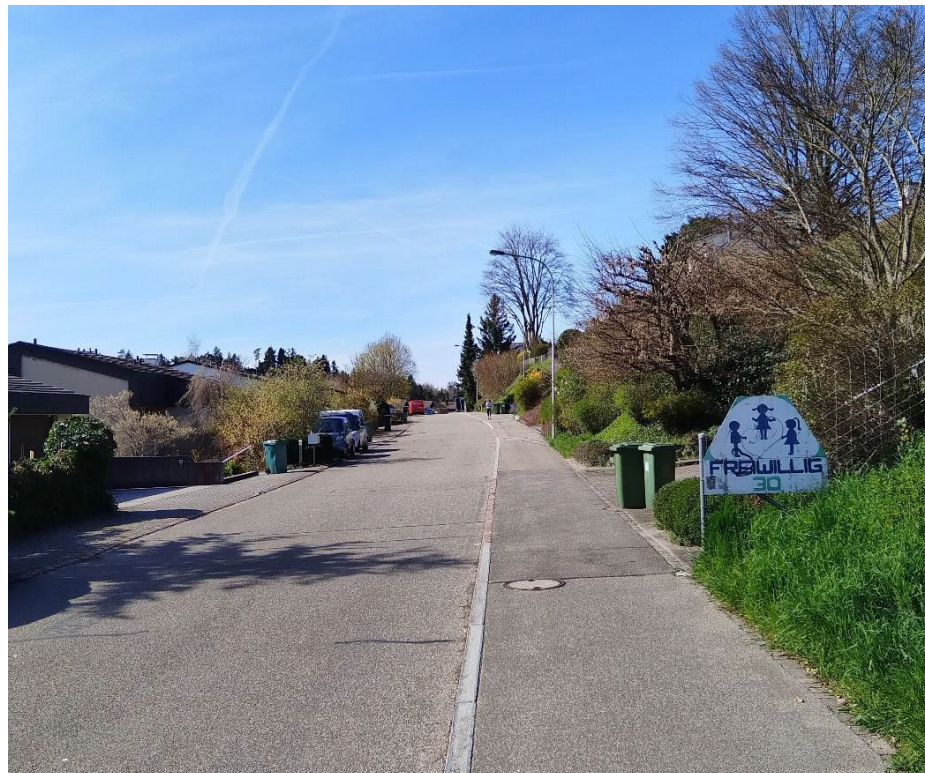
Abbildung 2 Chileholzstrasse

Über die Walkestrasse gelangt man auf den Chileholzstrasse, welche das lokale Quartier erschliesst und in einem Wendekreis endet. Die Walkestrasse weist kein Trottoir auf und führt in der Verlängerung aus dem Ortsteil Sulzbach hinaus. Zu Fuss gelingt man auch über den Chilenholzweg in das Quartier, welcher auch einzelne Liegenschaft für den Langsamverkehr erschliesst. Die Chileholzstrasse ist einseitig mit einem Trottoir ausgestattet. Grösstenteils ist die Strasse beidseitig bebaut (resp. bebaubar).