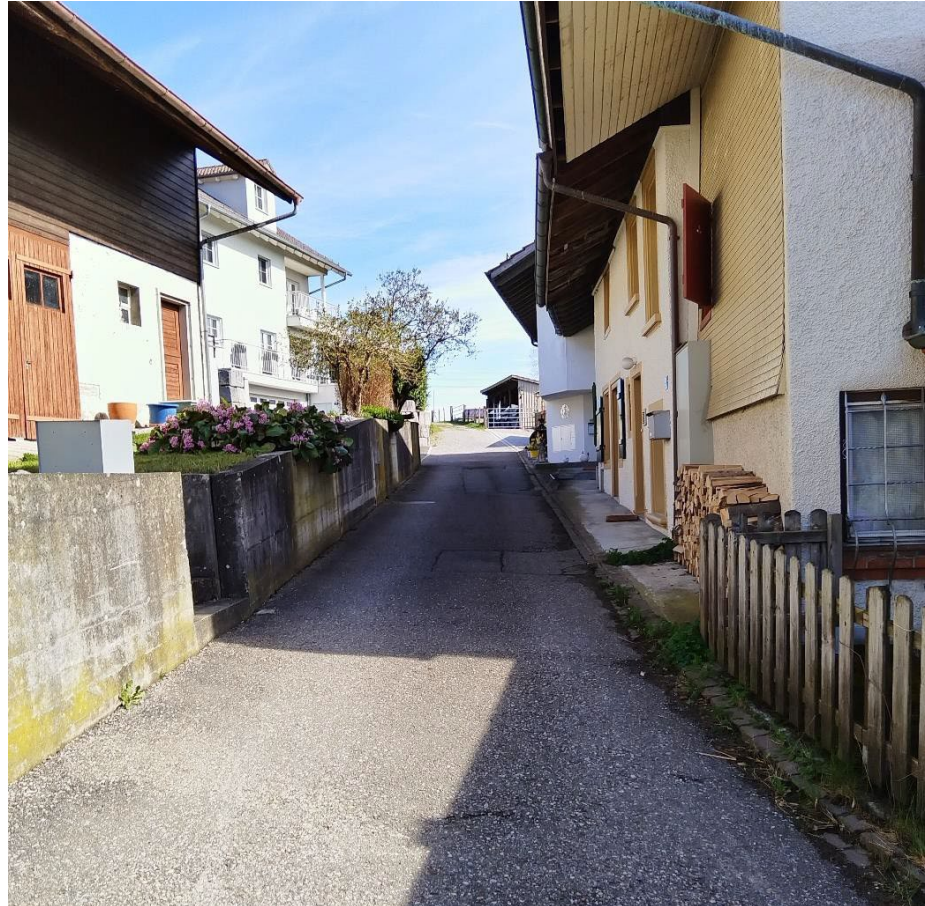
Abbildung 3 Flarzweg

Der kurze Flarzweg erschliesst nur wenige Liegenschaften am Siedlungsrand von Sulzbach. Er ist äusserst schmal, sodass sich entgegenkommende Fahrzeuge nur mit Mühe kreuzen können.