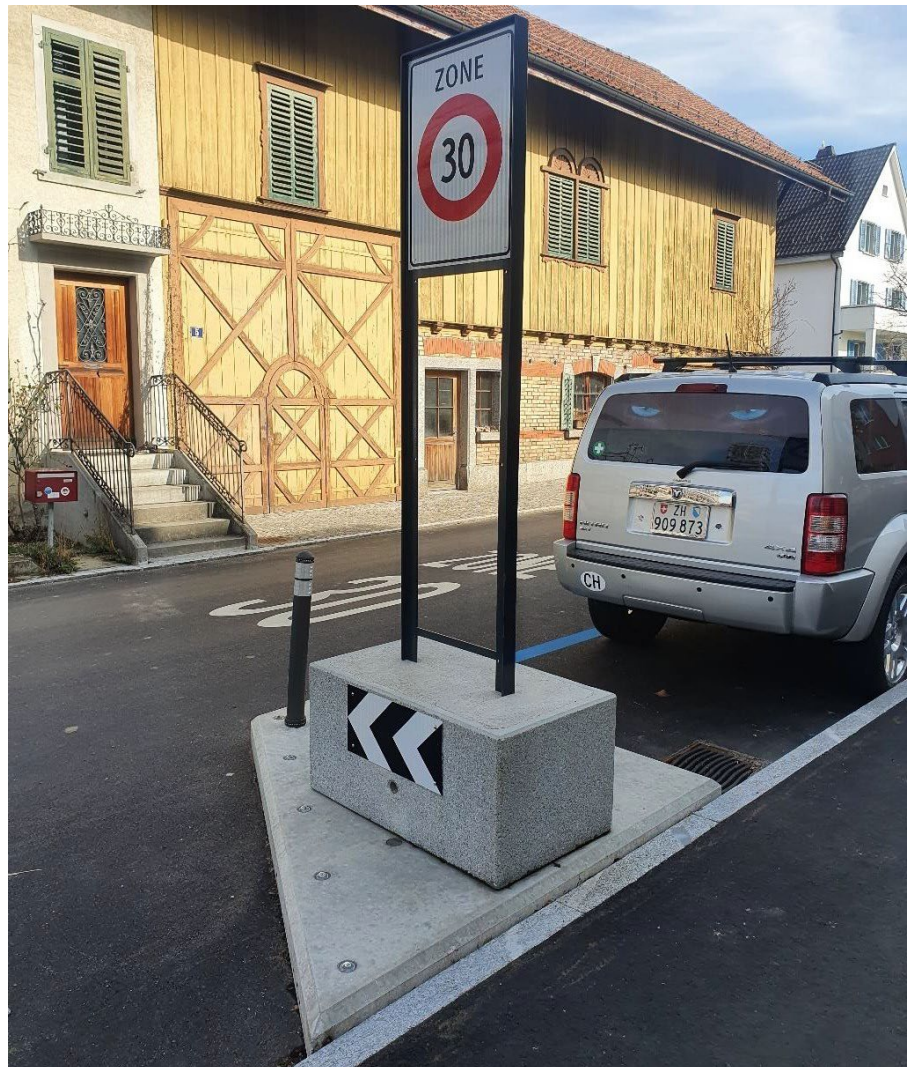
Abbildung 4 Referenzbild Zone 30 Signalisation in Uster

Dazu wird zur Signalisation der Zone 30 in der Stadt Uster folgendes Signal verwendet. Die exakten Standorte der einzelnen Recks zur Kennzeichnung des Beginns (resp. Wiederholung) der Zone 30 sind dem Signalisations- und Markierungsplan zu entnehmen.